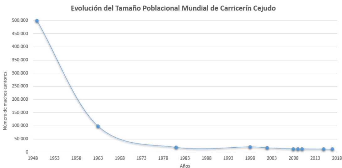
Gráfica de evolución del tamaño poblacional mundial del carricerín cejudo durante los últimos 70 años.

Los resultados de todas estas acciones, además de ser cartografiados en SIG, son monitoreados y evaluados en términos ambientales, sociales y económicos. Cobrando mucha importancia el análisis de los servicios ecosistémicos y socioeconómicos prestados por los humedales y derivados de las acciones del proyecto. También se ha realizado un importante esfuerzo de comunicación y difusión, acompañado de actividades de educación ambiental, charlas, visitas de campo, talleres y exposiciones itinerantes en centros educativos y sociales del área de influencia del proyecto.