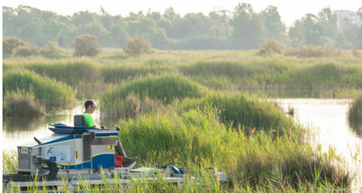
Máquina anfibia del LIFE Paludicola segando la vegetación palustre en un marjal costero valenciano.

Con los resultados obtenidos, publicados en artículos y notas científicas, y la documentación científico-técnica elaborada, se ha solicitado formalmente al Ministerio de Transición Ecológica y Reto Demográfico la inclusión del carricerín cejudo como Vulnerable en el Catálogo Español de Especies Amenazadas (CEEa). La petición cuenta con el apoyo nacional e internacionales de 32 entidades medioambientales y 16 investigadores expertos en la especie. De ser aprobada, otorgaría al carricerín cejudo un mayor grado de protección y garantizaría mejores herramientas de gestión y conservación tanto a nivel estatal como autonómico, que podrían extenderse a otras especies de ambientes acuáticos amenazadas como el carricerín real o el bigotudo.