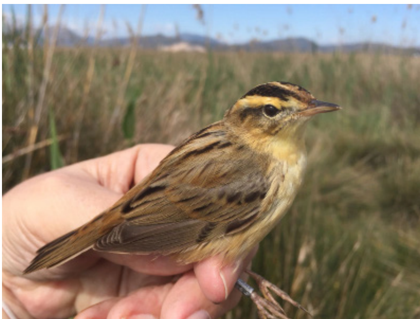
Ejemplar de carricerín cejudo ( Acrocephalus paludicola ) anillado.

Este es el caso del carricerín cejudo ( Acrocephalus paludicola ), el passeriforme más amenazado de Europa continental. Durante el siglo XX, esta especie ha sufrido una reducción del 95% en su tamaño poblacional como resultado de una drástica destrucción de su hábitat. En el siglo XXI continúa reduciéndose su población y su área de distribución a nivel mundial, sólo en los últimos 10 años, ha mermado su área de ocupación en un 70%.