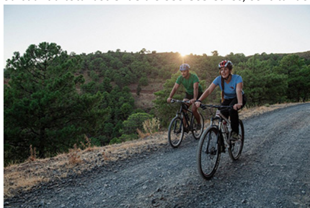
Cicloturismo en la Reserva de la Biosfera Sierra de las Nieves

El Plan de Sostenibilidad Turística de Sierra de las Nieves, contempla satisfacer las necesidades de esta reserva para tener un mayor atractivo turístico, optando con actuaciones como un parque de aventuras, espacios para aparcamientos de vehículos y el uso de lanzaderas, un recinto para autocaravanas, la adecuación y mejora de rutas senderistas y nuevos puntos de información turística. Su cuantía total asciende a 3.999.865 euros, solicitándose que el Gobierno central y la Junta de Andalucía aporten en cada caso el 40%; en tanto que la Diputación contribuiría con 600.000 euros (un 15% del total) y el 5% restante lo sufragarán los municipios. El plan se ha presentado a la edición de este año del programa de Planes de Sostenibilidad Turística en Destinos, cuya valoración y selección final, que concluirá el 25 de junio, la realiza la Secretaría de Estado de Turismo, con la participación de la Federación Española de Municipios y Provincias.