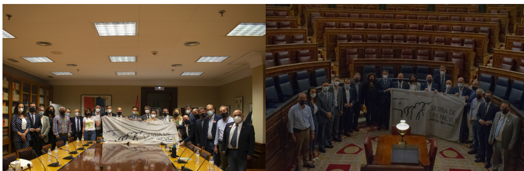
Apoyo institucional a la declaración del Parque Nacional

Hay que destacar que en el nacimiento, desarrollo y fortalecimiento de esta propuesta ha sido fundamental el empuje realizado desde su propia comarca. La implicación y los esfuerzos del propio territorio, de las administraciones de los distintos pueblos y de la Reserva de la Biosfera, la Sierra de las Nieves ha sido fundamental para conseguir este logro. La declaración del Parque Nacional Sierra de las Nieves se traduce en la máxima protección medioambiental que puede contar un espacio natural y el progreso de los distintos municipios que lo conforman, muchos de ellos pertenecientes a la Reserva de la Biosfera Sierra de las Nieves. La declaración es también gran aliado para luchar contra la despoblación. Por lo que es necesario la colaboración de todas las administraciones públicas, así como la inversión de empresas privadas para mejorar las infraestructuras turísticas.