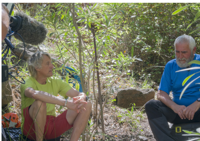
Diversos programas de alcance nacional se han grabado en la Sierra de las Nieves