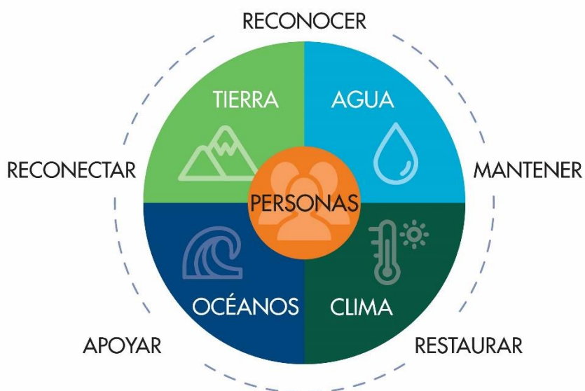
Figura 1. Síntesis del programa mundial de la UICN 2021-2024,