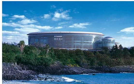
Figura 1. Isla de Jeju – Corea del Sur (izqda) y Centro de Convenciones Internacionales (dcha) donde se celebrará el Congreso.